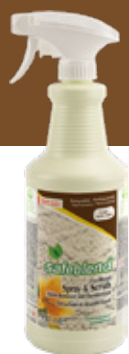
Parfum floral XGFLX0D – 12 x 950 mL