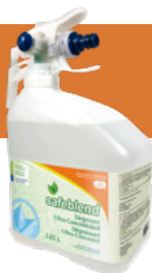
Sans parfum DUXXMD4 – 4 x 2.85 L