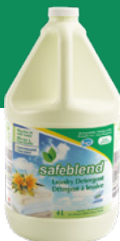
Parfum floral LEFRG04 - 4 x 4 L