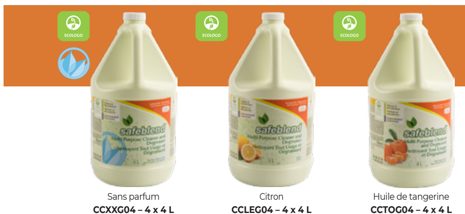
Sans parfum CCXXG04 – 4 x 4 L