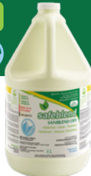
Sans parfum SRXXG04 - 4 x 4 L