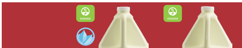
Sans parfum NCXXG04 - 4 x 4 L