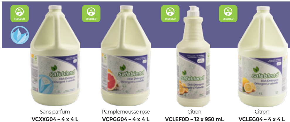
Sans parfum VCXXG04 – 4 x 4 L