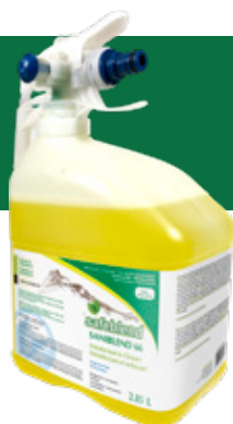
Sans parfum S66XMD4 - 4 x 2.85 L