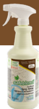
Sans parfum XRXXX0D – 12 x 950 mL