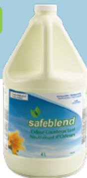
Parfum floral OCGEG04 – 4 x 4 L