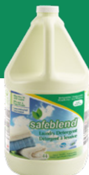
Sans parfum LEXG04 - 4 x 4 L