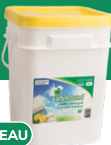
Citron LPLE1YS - 18 kg