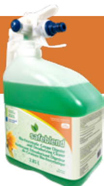
Floral ECFLMD4 – 4 x 2.85 L