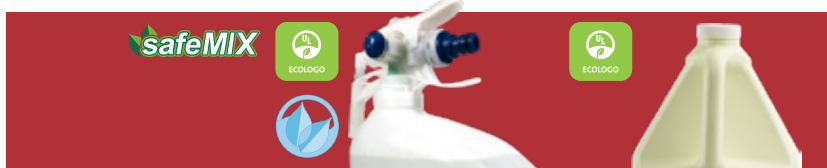
Sans parfum NUXXMD4 - 4 x 2.85 L