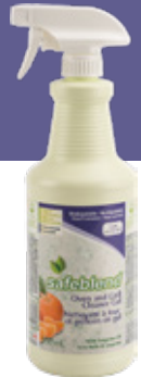
Huile de tangerine GUTOX0D – 12 x 950 mL