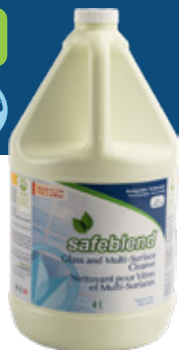
Sans parfum WRBXG04 - 4 x 4 L