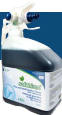
Sans parfum WUBXMD4 - 4 x 2.85 L