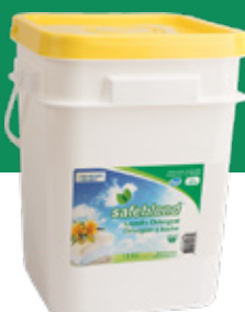
Parfum floral LPFR1YS - 18 kg