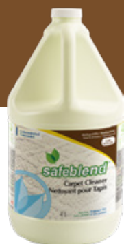
Sans parfum RCXXG04 – 4 x 4 L