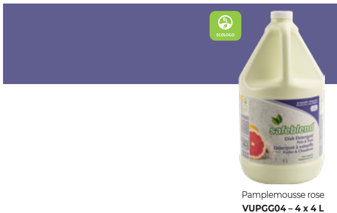
Pamplemousse rose VUPGG04 – 4 x 4 L