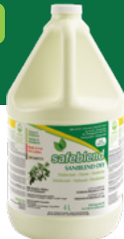
Huile de menthe poivrée SRXPG04 - 4 x 4 L