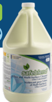
Sans parfum WUBXG04 - 4 x 4 L