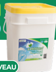
Sans parfum LPXX1YS - 18 kg