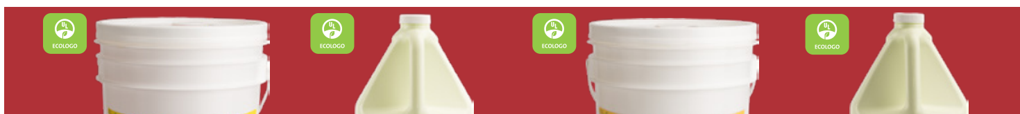
Orange NCORPW1 - 20 L