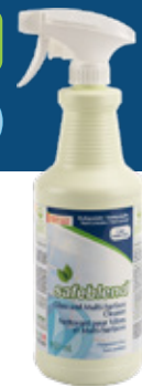
Sans parfum WRBX0D - 12 x 950 mL