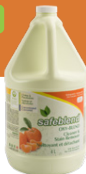
Huile de tangerine XCTOG04 – 4 x 4 L