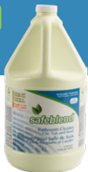
Fraîche odeur BTFRG04 – 4 x 4 L