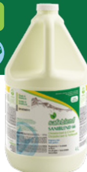
Sans parfum S66XG04 - 4 x 4 L