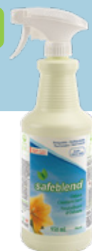
Parfum floral ORGEX0D – 12 x 950 mL