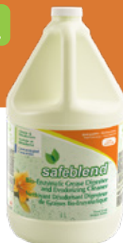
Floral ECFLG04 – 4 x 4 L